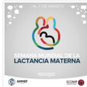
Lactancia Materna Juntos podemos hacer que la