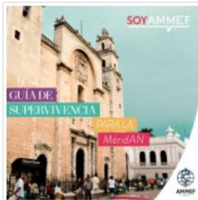
Guía de supervivencia ¿Ya estás listo para la #MéridaAN?