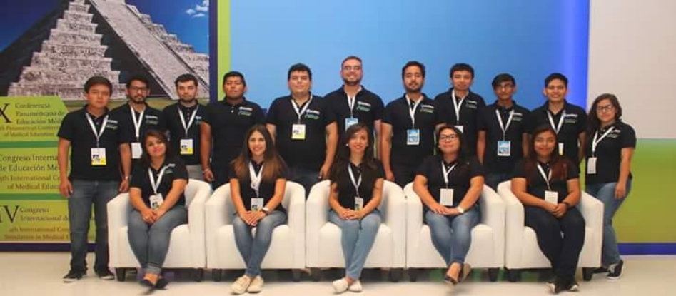
IFMSA- México presente en el V Congreso Internacional de Educación Médica de la AMFEM Cancún, México 2016