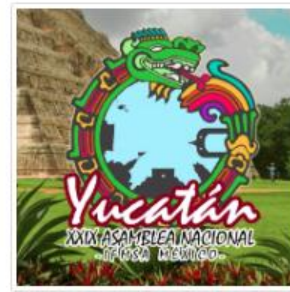
XXIX Asamblea Nacional.